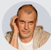
Petr Rychlý herec, moderátor, režisér