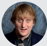
Lukáš Pavlásek herec a komik