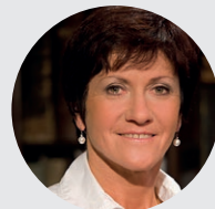
Květa Pecková Trojnásobná olympijská medailistka